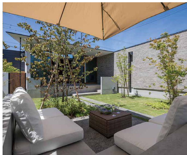
設計: 遠藤誠