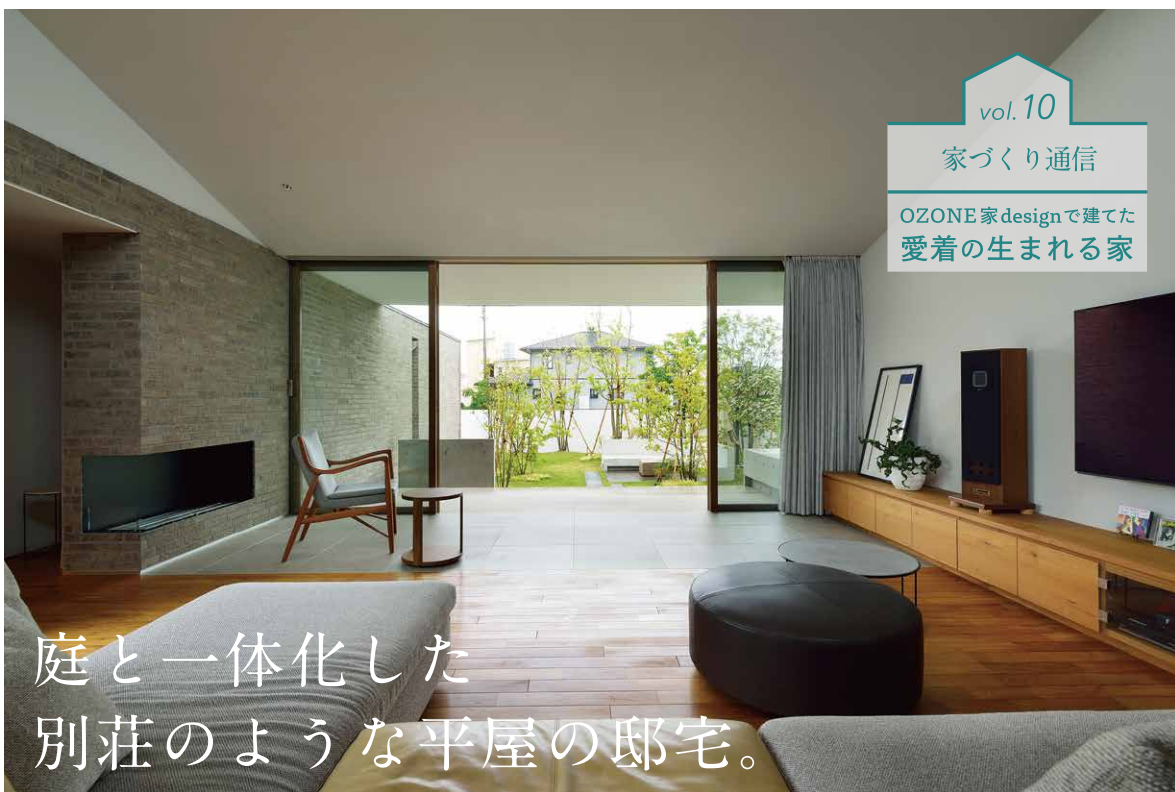
設計: 遠藤誠 / 撮影: 大槻茂

LDKタイプの間取りが増え、レイアウトの考え方が変化するなか、キッチンとはどんな魅力的な空間になっています。一方、ダイニングはどうでしょうか? 今回のリフォームでは、ご友人を招く機会が多いお客様のご要望を受け、都会の眺望を楽しみながらホームパーティーが楽しめる空間をご提案しました。家具は、窓の外の風景に調和するシンプルなディテールを厳選。アクセントとして、彫刻のように立体感のある照明をセレクトしました。ライフスタイルに合わせた空間づくりで、人と集う時間をもっと豊かなものにしてみませんか。